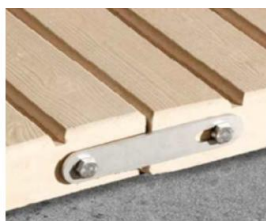
Sistema anclaje y articulado